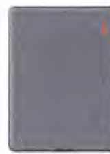
Bamboo Slate, grande