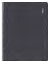
Bamboo Folio, grand