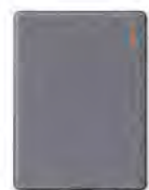
Bamboo Slate, petite