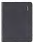
Bamboo Folio, petit