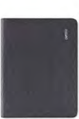
Bamboo Folio, petit