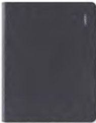
Bamboo Folio, grand