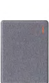
Bamboo Slate, petite