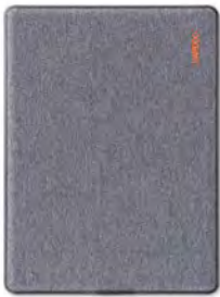
Bamboo Slate, grande